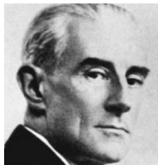
Maurice Ravel (1875-1937)