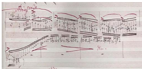
Extrait du manuscrit de la Sonate pour piano en si mineur